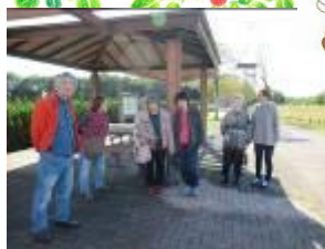
昨年11月の外出時の写真です。